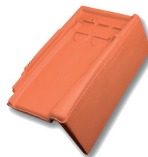
Gevelpan rechts dekkende breedte ca. 140 mm