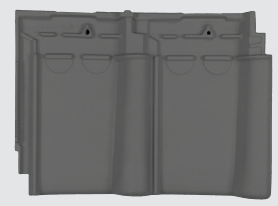
blauw gesmoord (876)