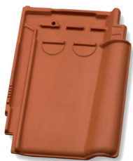
Halve pan dekkende breedte ca. 195 mm

Minimaal 10 mm. ruimte houden tussen gevelpanflap en boeiboord!