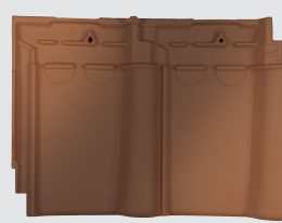
rood rustiek (812)