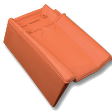
Gevelpan links dekkende breedte ca. 192 mm