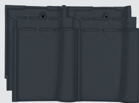
Matzwart engobe (868)