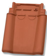
Dubbele welpan dekkende breedte ca. 238 mm