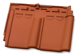
Ventilatiepan luchtopening ca. 11 cm 2